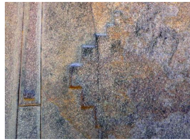
Escaleras en espiral. A la izquierda en Ollantaytambo y a la derecha en Cusco, Perú.

La religión católica tiene también su trilogía divina: padre, hijo y espíritu santo. El hinduismo tiene su tri-murti (tres formas) para referirse a sus dioses: Brahma, el creador, Vishnú, el preservador y Shivá, el destructor (que da paso a la creación en un ciclo que se perpetúa en el tiempo).